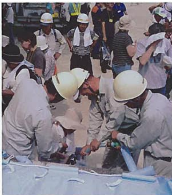
水道局と合同による防災訓練