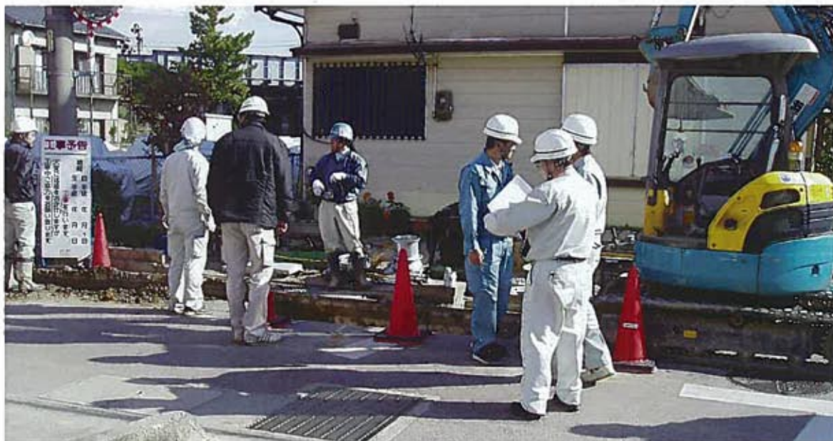
安全パトロール活動

来年度は何事においても厳しい年になると思われれます。当組合も各委員会、各組合員が、がんばってこの不景気を乗り切り、よりよい組合になればと思います。