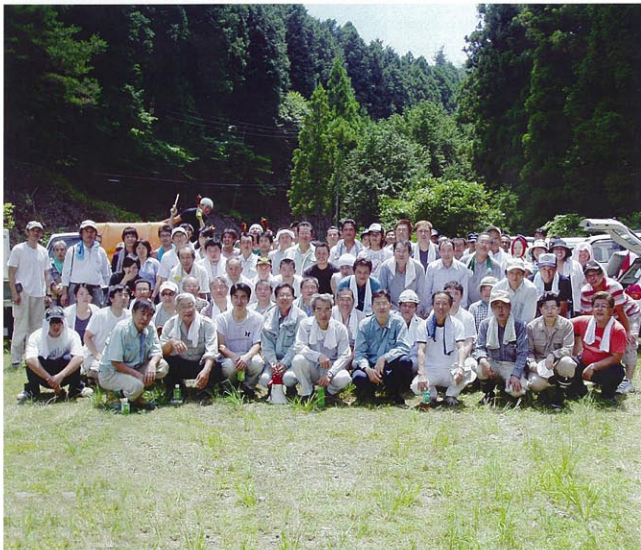
H20-7-26 (土) 額田巴山下草刈り